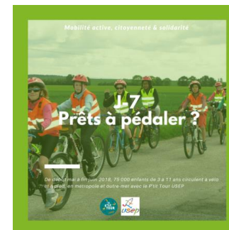
Illustration : ajouter les photos de l'équipe

A 7 jours du départ de l'étape du P'tit Tour USEP qui ralliera [VILLE À PERSONNALISER] à [VILLE À PERSONNALISER], nous vous présentons l'équipe d'enseignants et de bénévoles qui accompagnera les [chiffres] enfants. Merci à vous !