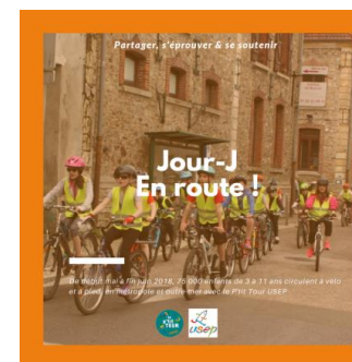
Illustration : ajouter les 1ères photos de l'étape